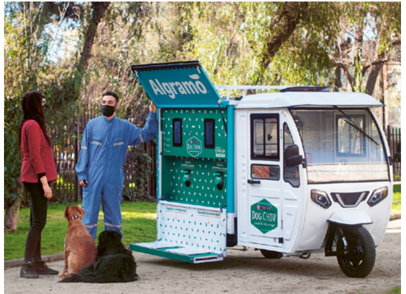
Faciliter l'accès aux possibilités de recharge et de réutilisation pour nos consommateurs