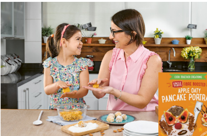
Sensibiliser les enfants à la valeur nutritionnelle de la cuisine

En mai 2020, nous avons lancé la nouvelle initiative Cook Together . Avec près de 40 marques Nestlé participantes au niveau mondial, Cook Together a touché plus de 225 millions de parents, encourageant les familles à passer plus de temps en cuisine à préparer ensemble des repas nutritifs. En novembre, une deuxième campagne a été lancée, avec un livre de cuisine, des concours et des prix.