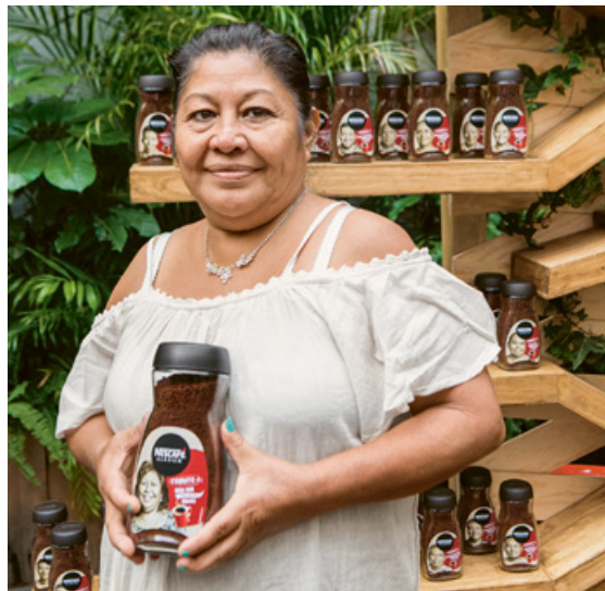
Tisser des liens entre les consommateurs et les caféiculteurs

En 2020, nous avons lancé une campagne multimédia pour saluer leur travail exceptionnel. Nous avons ainsi partagé leur histoire à l'aide de photos sur des emballages, d'affiches aux points de vente, de panneaux d'affichage et de posts sur les réseaux sociaux. Cette campagne visant à rapprocher les consommateurs de café des caféiculteurs contribuant à la production de Nescafé a totalisé plus de 9 millions d'impressions.