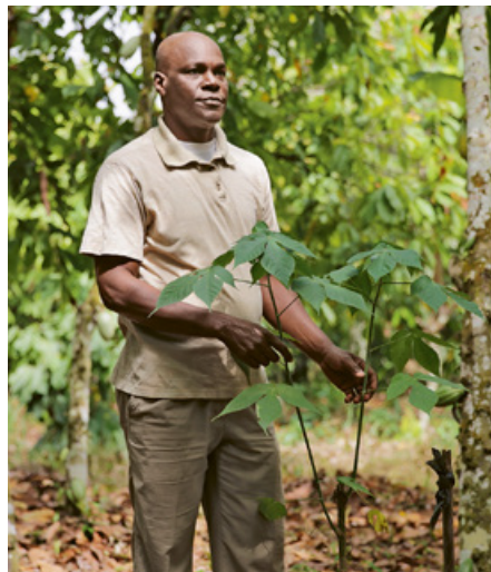
Fournir aux agriculteurs des plantules pour préserver l'environnement