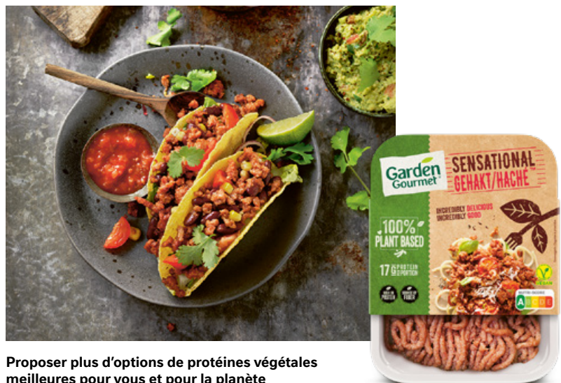
Proposer plus d'options de protéines végétales meilleures pour vous et pour la planète

Nestlé dispose d'un solide portefeuille d'options à base végétale. En août 2020, nous avons développé des alternatives végétales aux produits de la mer. Notre alternative au thon, la dernière-née de la marque Garden Gourmet , contribue à réduire la surpêche et à protéger la biodiversité des océans. Composée d'uniquement six ingrédients d'origine végétale, elle est riche en protéines et en acides aminés essentiels, et ne contient ni colorants artificiels ni conservateurs. Nous avons développé cette alternative au thon en neuf mois grâce à notre profonde expertise R&D en science des protéines et à nos technologies exclusives.