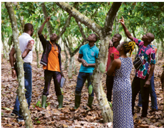
Investir dans un avenir durable pour les communautés agricoles

Lancé en août 2020, le programme pilote du projet vient en aide à 1000 agriculteurs. Ils reçoivent des incitations financières en contrepartie de résultats sociaux et environnementaux positifs obtenus grâce à de bonnes pratiques agricoles, la plantation d'arbres d'ombrage et la lutte contre le travail des enfants. L'avancement du projet sera étroitement suivi. L'évolution et les résultats seront rendus publics.