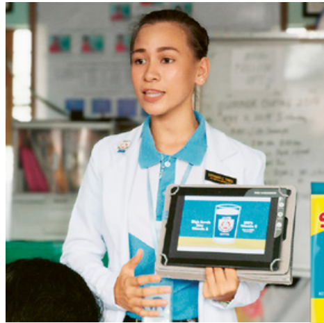
Aider les consommateurs à faire des choix éclairés concernant leur apport nutritionnel

BEAR BRAND propose des aliments et boissons enrichis abordables. Cœuvrant pour un meilleur accès aux informations nutritionnelles, BEAR BRAND a récemment lancé un nouvel outil numérique d'évaluation nutritionnelle, le Tibay Calculator. Cet outil aide les parents à mieux comprendre la qualité et la diversité de l'alimentation de leurs enfants. En collaboration avec le «Food and Nutrition Research Institute», des chercheurs de Nestlé Research ont conçu un algorithme calculant les scores de diversité alimentaire et identifiant les carences en nutriments dans l'alimentation des 6-12 ans.